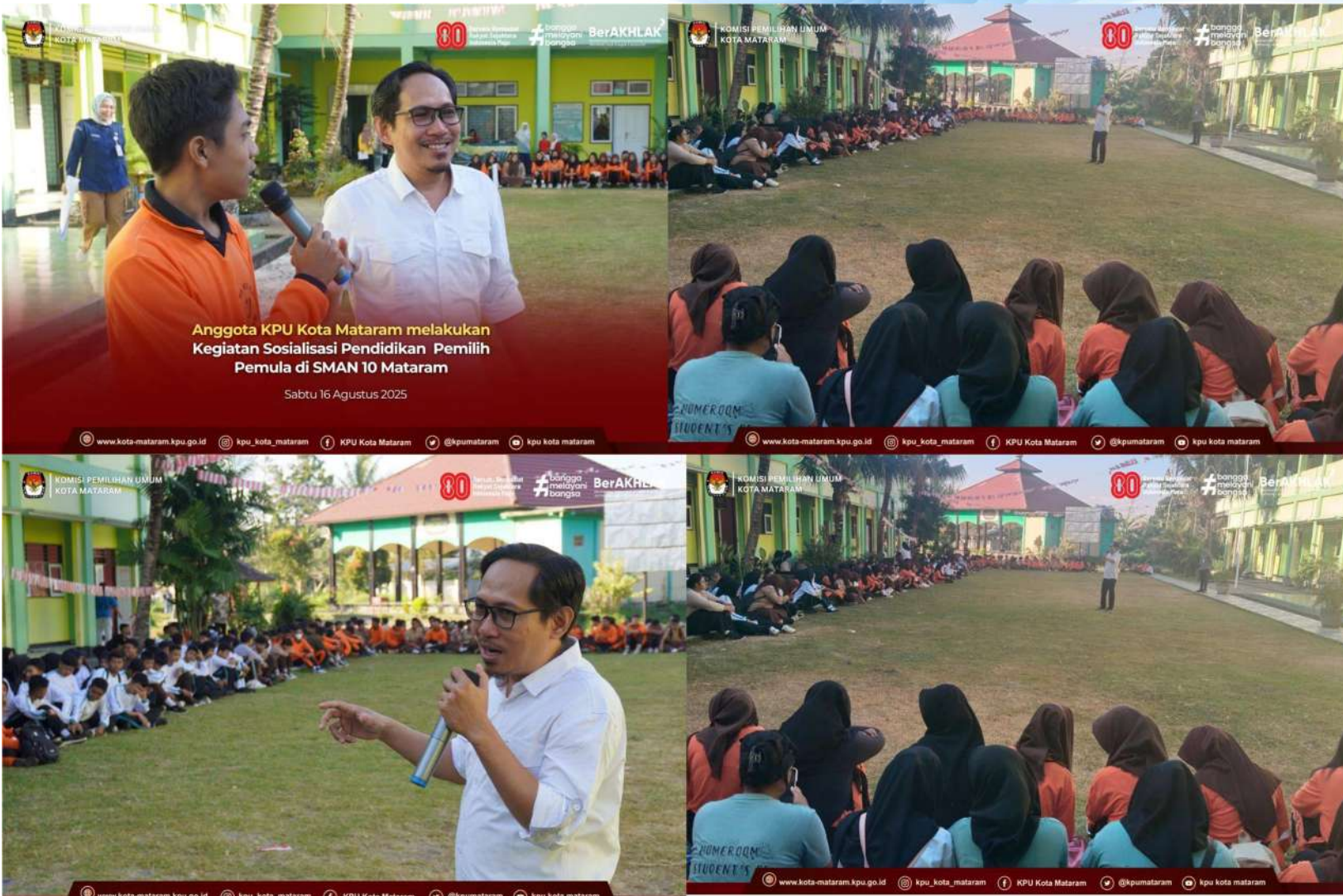
Anggota KPU Kota Mataram melakukan Kegiatan Sosialisasi Pendidikan Pemilih Pemula di SMAN 10 Mataram