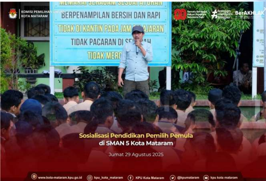
Sosialisasi Pendidikan Pemilih Pemula di SMAN 5 Kota Mataram Jumat 29 Agustus 2025